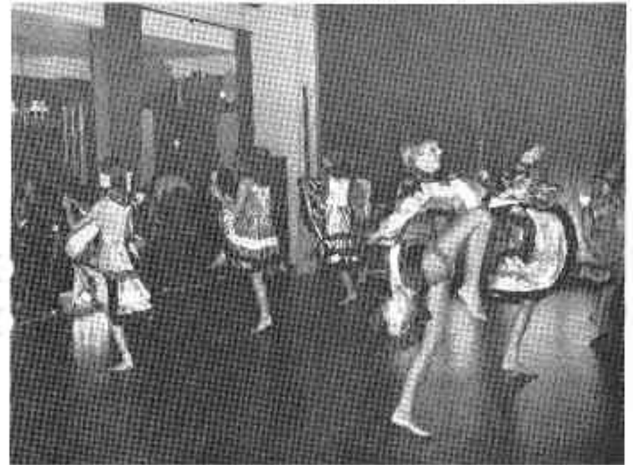
Zum Abschluß ein heißer Can-Can

müssen, bewiesen 8 Turnerinnen in ihren Gymnastikanzügen, die sie mit Spielkarten dekoriert hatten. Sie boten eine hervorragende Leistung. Bei der Ankündigung einer Striptease-Show waren es die Männer, die sich auf ihren Stühlen zurechtrückten, um besser sehen zu können. Hinter einer bunten, angestrahlten Leinwand waren schemenhaft 9 hübsche Figuren zu erkennen, die elegant ein Kleidungsstück nach dem anderen über die Wand in den Saal warfen. Aber ach, wie groß war die Enttäuschung, als bei voller Lichtstärke 9 alt-vermummte Gestalten zum Vorschein kamen, die dann aber doch ihre alten „Klamotten“ ablegten und in farbigen Gymnastikanzügen ihre gekonnte Gymnastik zeigten.