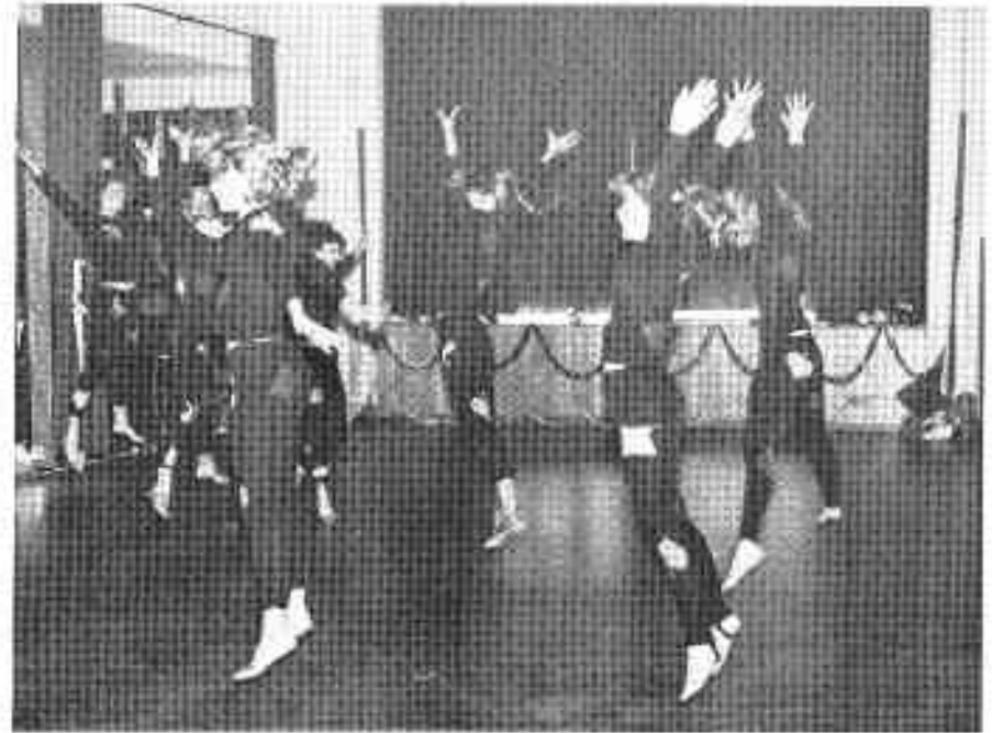
Kreuz, Herz, Pik, Karo – ein gutes Blatt – nicht nur für Skatspieler

Tanzsaal und Clubräume für Feierlichkeiten aller Art – wie Hochzeiten, Jubiläen, Betriebsfeste, Kohl- und Pinkelfahrten, Aalessen usw. – Fremdenzimmer –