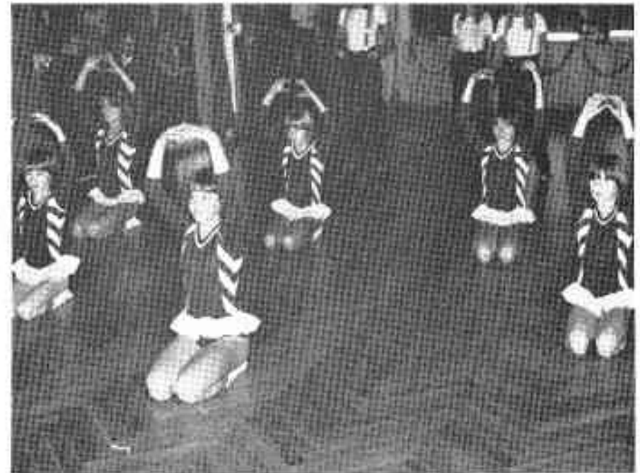
Die Jüngsten im Cabaret-TVA

Schon wirbelten 14 junge Turnerinnen in den Saal nach einer Musik von Liza Minelli. Zu ihren kecken Kostümen trugen sie bunte Girlanden, die sie einigen Gästen während der Vorführung um den Hals legten. Gleich stieg die Stimmung, und die Gäste dankten es mit Beifall und ausgelassener Fröhlichkeit.