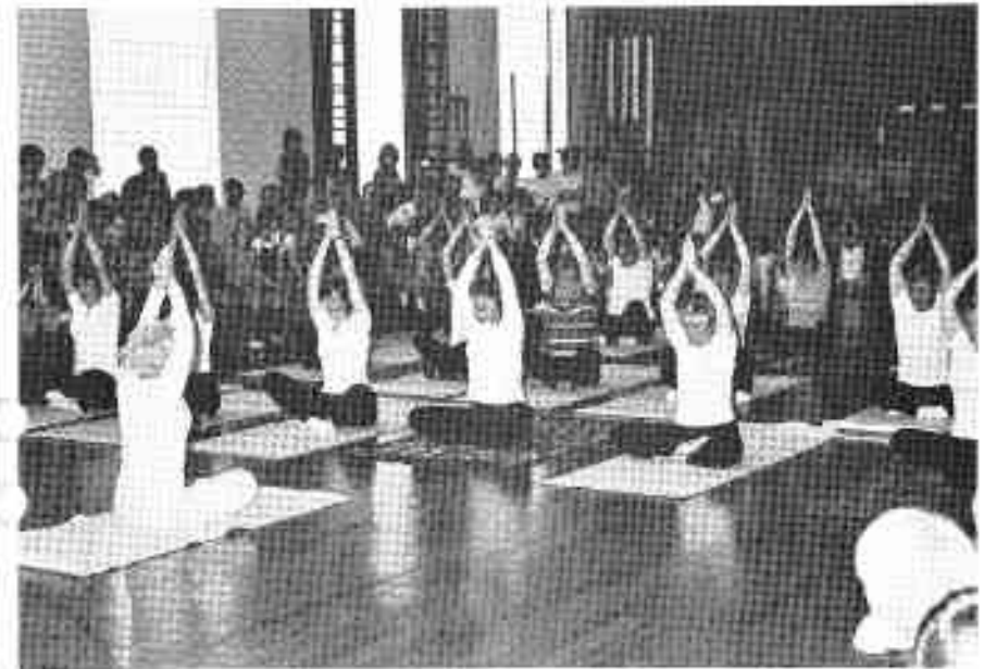
Yoga-Gymnastik zur Feier „50 Jahre Turnhalle“