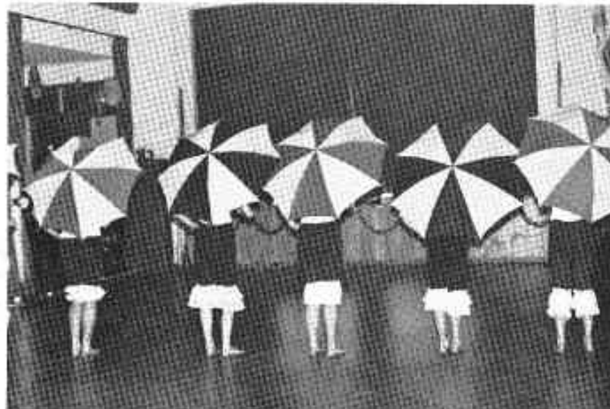
Ganze Abteilung ... kehrt!

2800 BREMEN 44 - Hemelinger Bahnhofstraße 2a - Telefon 45 10 36 Parkplatz hinter dem Hause